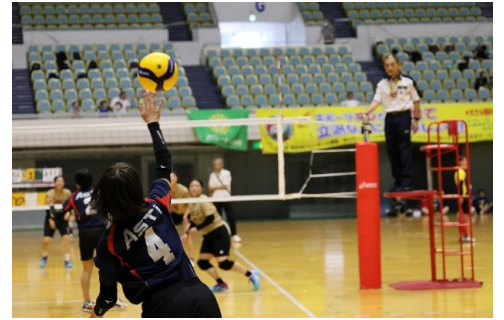
競技風景 (6人制女子)