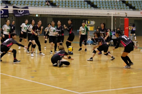
競技風景 (9人制ママさん)