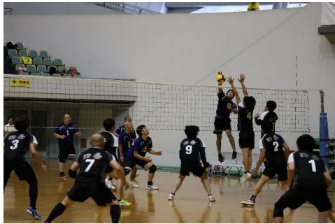
競技風景 (9人制男子)