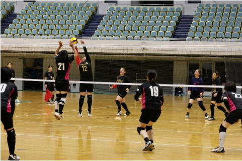
競技風景 (6人制ママさん)