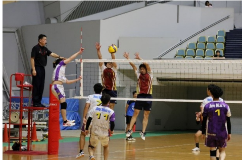
競技風景 (6人制男子)