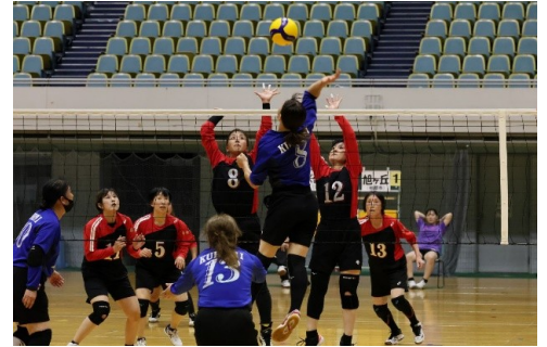
競技風景 (9人制女子)